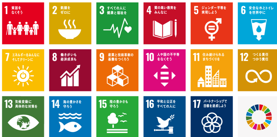
▲ 図2 SDGsの17の国際目標アイコン

なお、本戦略の具体的施策とSDGsの進むべき方向性が合致するものには、17の目標のアイコンを掲げています。