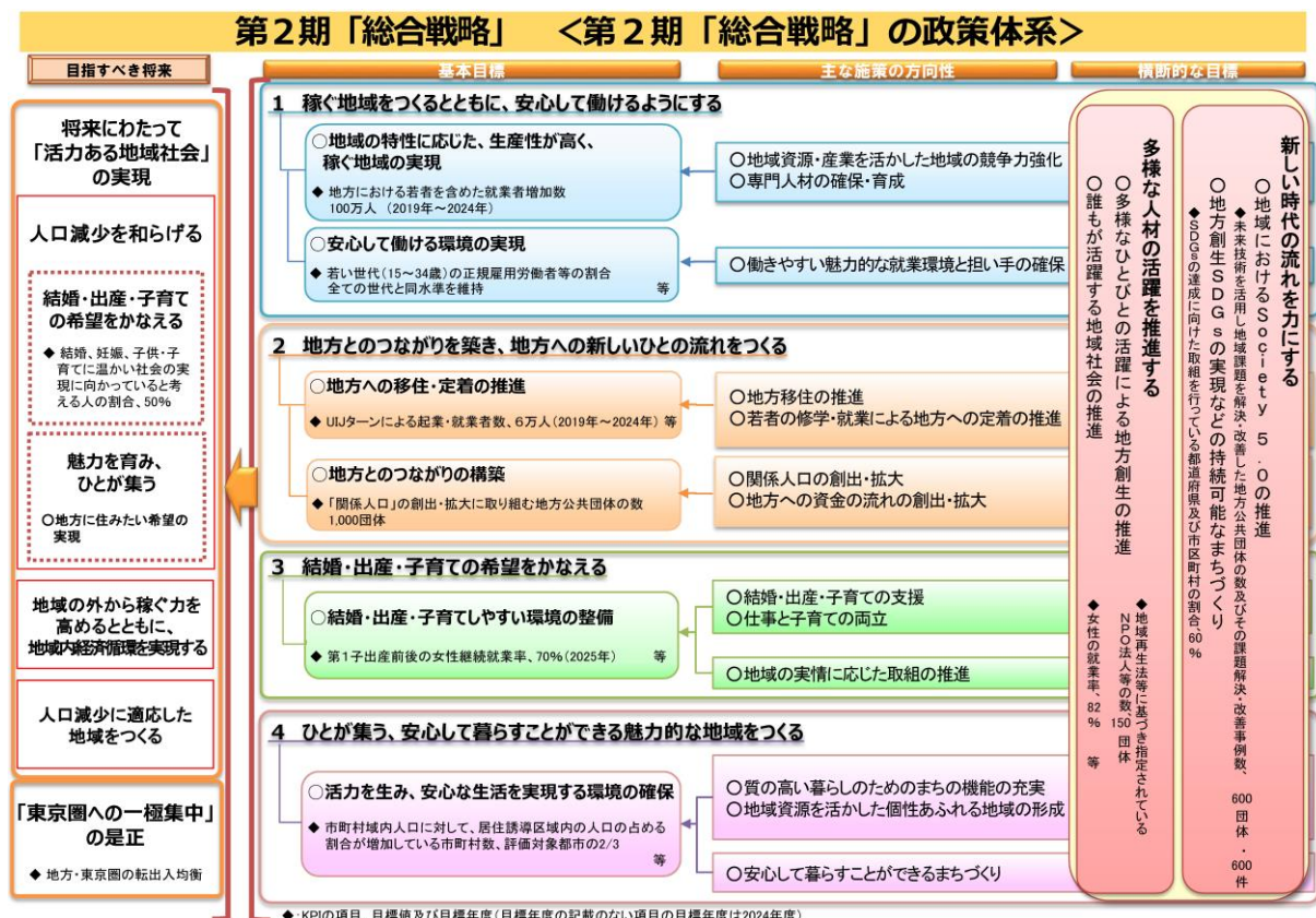
▲ 図 1 第2期総合戦略の政策体系

SDGsを原動力とした地方創生の推進に向け、多様なステークホルダーにおける一層の浸透・主流化を図る。