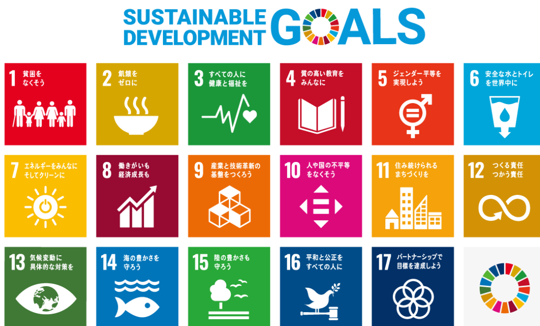
▲図2 SDGsの17の国際目標アイコン

以上のことから、SDGsの理念に沿って持続可能なまちづくりや地域の活性化に取り組むことで政策全体の最適化や課題解決の加速化といった相乗効果も期待でき、地方創生の取り組みの一層の充実・深化につなげることができるため、本町においてもSDGsの視点を取り入れ、持続可能なまちづくりをめざします。