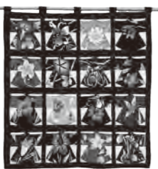
隣保館で講師として教えています。すべて違う夏の浴衣で作りました。