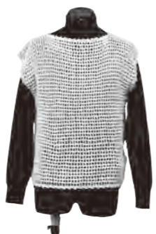
白色のシンプルなベストとなりました。