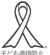
子ども虐待防止 オレンジリボン運動

子どもへの虐待は、子どもの成長・発達に悪影響を与えます。虐待には、殴る蹴るなどの身体的虐待、食事を与えないなどのネグレクト（育児放棄）、言葉で脅すなどの心理的虐待、性的虐待があり、しつけとは異なるものです。