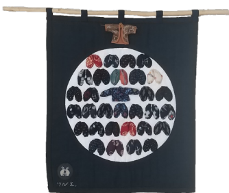
作品名「モンペのタペストリー」