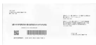
①宛名台紙(問い合わせ先記載あり)