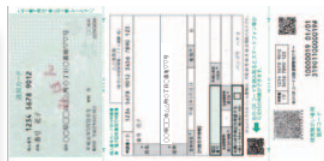
②通知カード + 個人番号カード交付申請書兼電子証明発行申請書 + 音声コード台紙