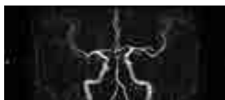
△ 1.5 テスラ 脳血管前から見た画像

このように磁場強度が大きくなることにより、また、装置の性能により、短い時間でよりきれいな画像を作ることができます。病気の診断にあたっては、その症状や診断目的にあった