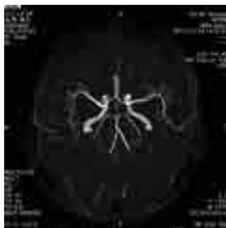
△ 1.5 テスラ 脳血管下から見た画像

当院では、2年前の最新CT装置導入に続き、平成25年12月に、1テスラのMRI装置から新たに最新鋭の1.5テスラMRI装置を導入しました。この画像は、当院で撮影した同一人物の脳血管画像です。撮影時間は、1テスラ装置約7分、1.5テスラ装置約5分弱です。画像を比較すると1.5テスラ装置の方が障害となる陰影もなく細部の血管まできれいに描出され、より広い範囲が撮影されています。