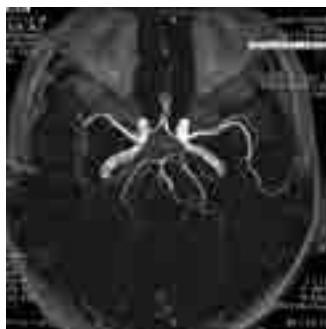
△ 1 テスラ 脳血管下から見た画像

このように磁場強度が大きくなることにより、また、装置の性能により、短い時間でよりきれいな画像を作ることができます。病気の診断にあたっては、その症状や診断目的にあった