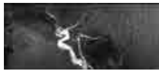
△ 1 テスラ 脳血管横から見た画像