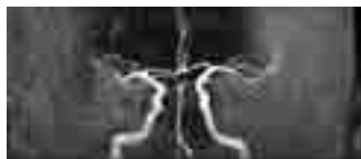
△ 1 テスラ 脳血管前から見た画像