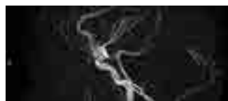
△ 1.5 テスラ 脳血管横から見た画像