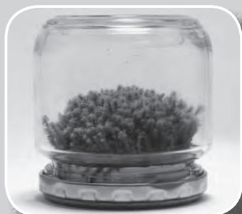
コケのテラリウム