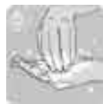
指先、爪もよく洗う。