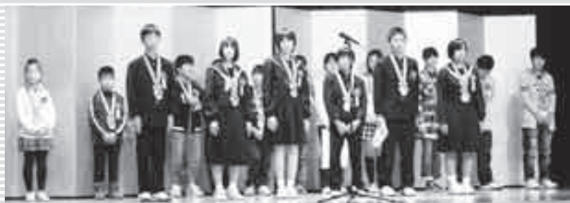
審査委員長（教育長）の講評

児童・生徒たちは、一生懸命に発表してくれました。年々、素晴らしい発表となり、甲乙つけがたい審査結果でした。今回のこの経験が将来、大きな力、大きな宝となることでしょう。