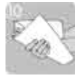
ペーパータオルなどで拭く。