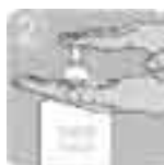
たすけんを石けん用消毒薬のひらにとる。