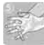
指の間や指もよく洗う。