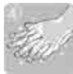
甲の手で手のひらを洗う。反対も同様に。