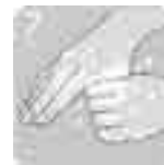
親指の周囲もよく洗う。