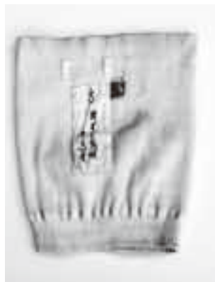
▲ガードル型の岩田帯