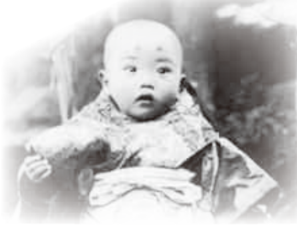
▲昭和初期の赤ちゃん

鞍手町歴史民俗資料館では出産と育児に関する民俗を紹介します。私たち一人ひとりが、望まれ、祝福され、大切に育まれた「命」であることを実感できる企画展です。