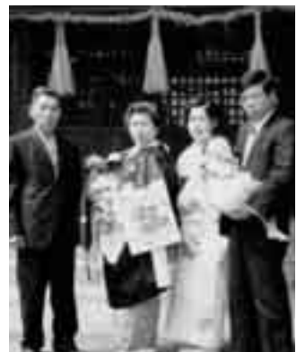
▲昭和 50 年代の宮参り