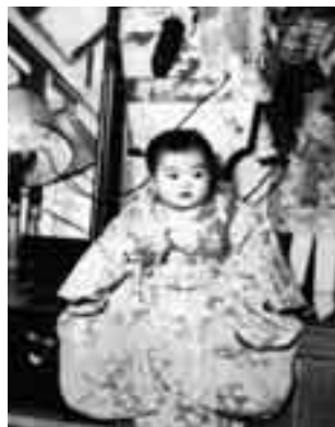
▲昭和初期の初正月