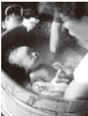
▲昭和 30 年代の産湯を使う新生児

今、お産は仰向け状態するのが一般的ですが、大正時代初め頃までは座って産むのが普通でした。座産の場合は、タンスの持ち手やハシゴ、天井から下げた力綱につかまって産んだということです。