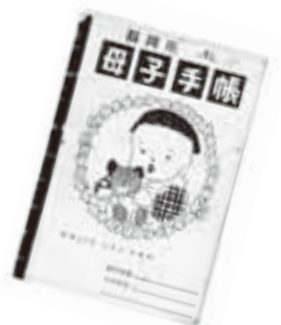
▲昭和 39 年の母子手帳