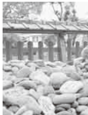
▲宇美八幡宮の子安の石