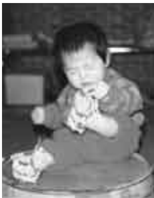
▲昭和 50 年代の初誕生

◆ 宮参り 宮参りは、赤ちゃんが初めて氏神様に参り、ムラの成員として認められる儀礼で、生後30日前後に行われました。 赤ちゃんには産婦の里から贈られた宮参り着物を着せ、姑が赤ちゃんを抱き産婦とともに参ります。神前に参ると、拝殿に子どもを寝かせ、わざと泣かせて氏神様に声を聞かせ、氏子になったことを報告しました。 帰りには親戚に立ち寄り、お神酒とイリコをいただいたり、晴れ着の紐にヒモ銭を結んでもらったり、長生きできるようにと年長者に抱いてもらったりしました。