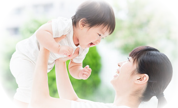
あなたのやさしさが、こどもたちの未来につながっています