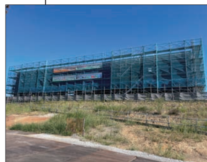
③ 博物館別館 屋根・外装施工