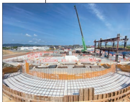
① 庁舎棟 鉄骨建方開始