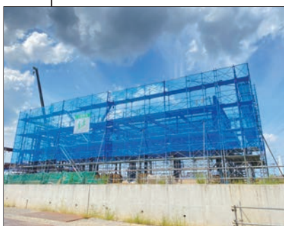
② 車庫棟 鉄骨建方完了