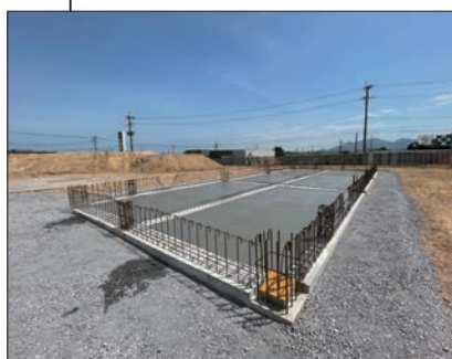
② 車庫棟 基礎躯体