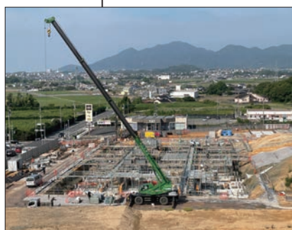
① 庁舎棟 基礎躯体