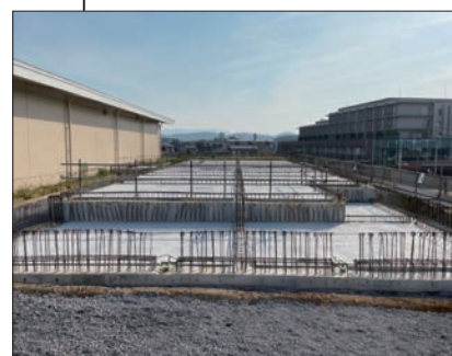
③ 博物館別館 基礎躯体