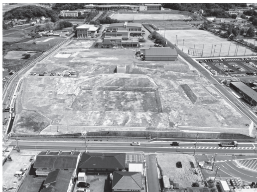
▲新庁舎等建設予定地を北側（大池団地方面）から撮影した令和4年6月時点の様子

これから本格的に建設工事が始まります。周辺にお住まいの皆さんをはじめ、中央公民館、町立体育館などの文化体育総合施設やからて病院をご利用の皆さんにはご迷惑をおかけいたしますがご理解とご協力をお願いいたします。