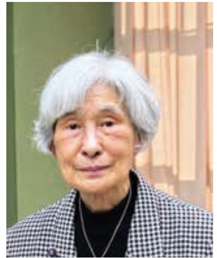
西藤 典子 議員

五つ目に固定的な性別役割分担意識をなくし、家庭生活・地域活動などと仕事とが調和できること。