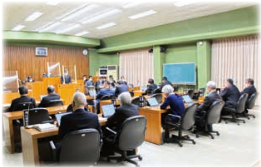
▲新型コロナウイルス感染症対策のためマスクを着用しています。

一般質問とは、町長から提出された議案以外に、行政に対する疑問点について質問することです。