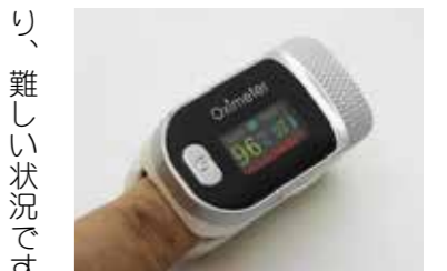
▶パルスオキシメーター

消費税の減税・免税、女子学生に対して無償配布など。スコットランドでは2022年8月15日、地方自治体や教育機関に対し、生理用品の無償提供を義務づける法律が施行されています。