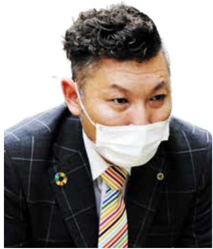
有働 徳仁 議員

その他「旧統一教会」「世界平和統一家庭連合」による町政へのかわりについて」の質問を行いました。