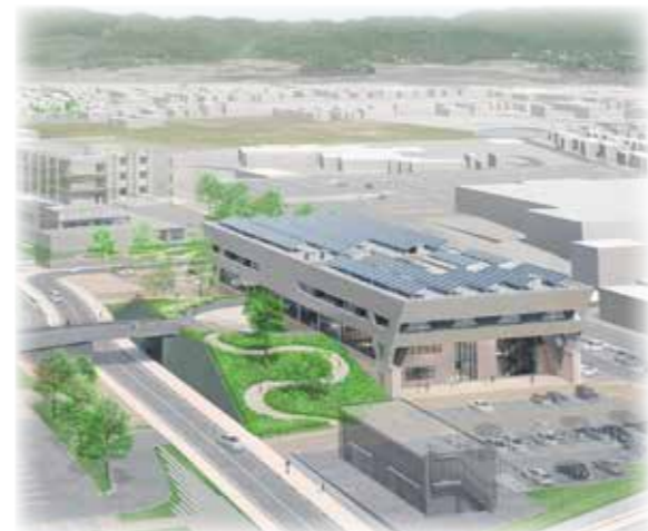
▶新庁舎完成予想図