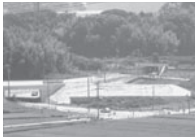
工事が進む(仮称)筑豊インターチェンジ

育っています。 少子化対策は、乳幼児医療費を就学前まで無料にしました。出産育児一時金は10月から42万円に引き上げます。 女性の地位向上とまちづくり参画促進は、本年4月、「男女共同参画推進条例」を制定、施行し、今取り組んでいるところです。 生活環境及びインフラ整備ですが、特に河川管理等住環境の整備が必要で、水害対策として、西川の改修に取り組むという県の回答を得ています。また、中山の浸水常襲地区についても、支援・指導を求める要望を出し