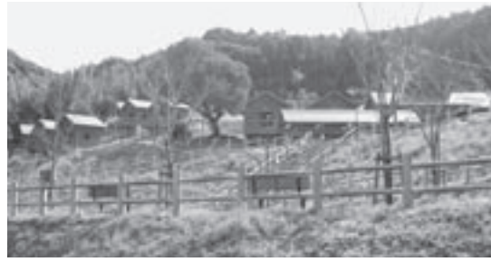
水遊び施設が望まれている大谷自然公園

質問 以前私が行ったとき、利用者がビニールプールを持ってきて、子どもたちに水遊びをさせていました。水遊びができるような施設を備えて、大自然の中で子どもたちがワイワイやっているのが自然公園の姿ではないかと思えます。利用者を増やすために、町のバスを利用してはどうですか。