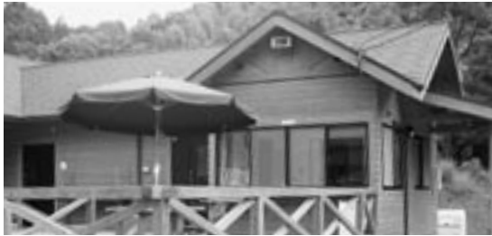
大谷自然公園 管理棟