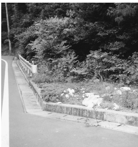
不法投棄された現場