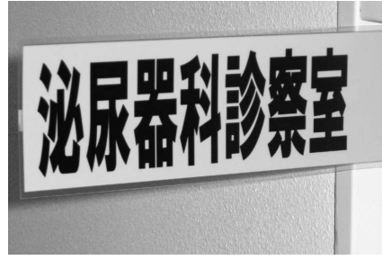
町立病院の泌尿器科診察室