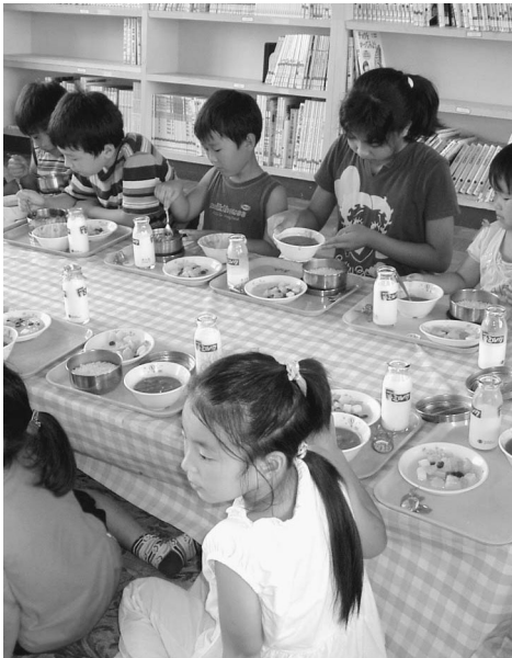
室木小学校の1年から6年合同の誕生給食

解消が逆に広がり、広域連合そのものが成り立っていない状況にあります。当町も離脱を考へるべきではないか。