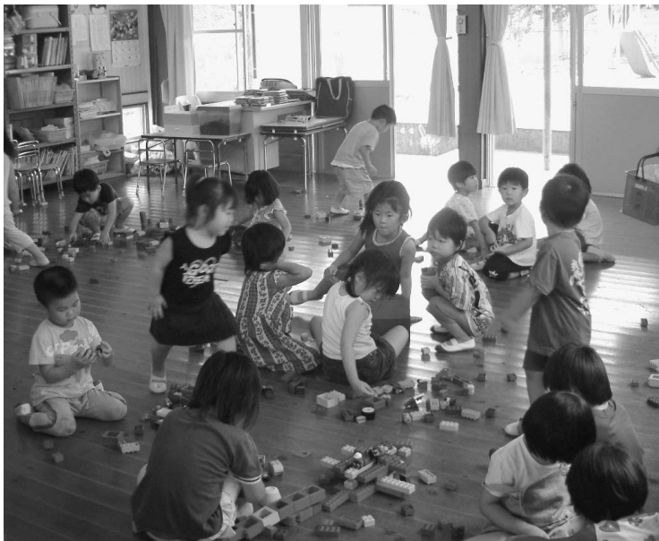
楽しく遊ぶ西川第1保育所の園児