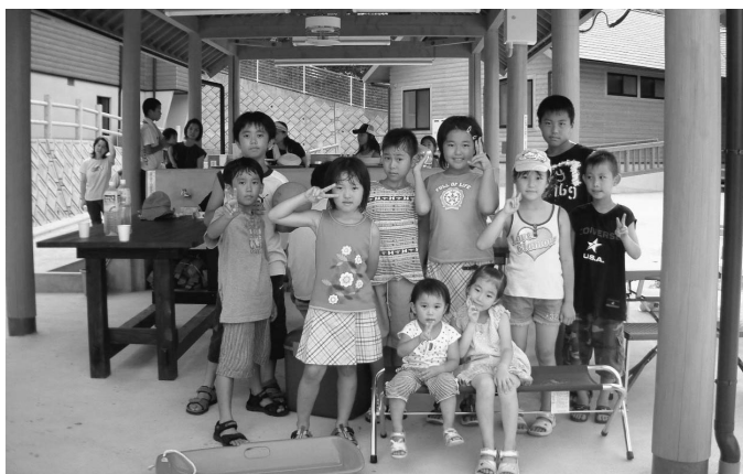
大谷自然公園を利用する子どもたち

備体制については、7月1日から9月30日までの間、宿泊客がいる場合は、昼は1人、夜は2人の警備員を置き、土・日・祝日については宿泊者がいなくても昼間1人を置くことにしています。