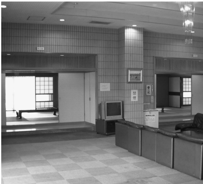
町葬斎場の待合室（控室）