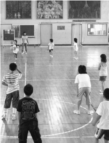
学校体育館も民間委託に