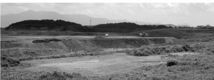
企業誘致のための造成地（宮若市）

町長 町有地、工場適地の売り込みは努力しています。しかし、かつては、坪5、6万で売れた土地が今では、3万以下でないと売れません。造成費をいかに安く抑えて、提供できるかにかかっています。県の協力も得て造成費を浮かす研究をしていかなければなりません。