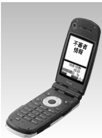
メールによる不審者情報の提供

メールによる不審者情報の提供は、剣南小で実施しており、他の小中学校育成部会やPTAの方に賛同が得られれば、今後、推進していきたいと思っています。