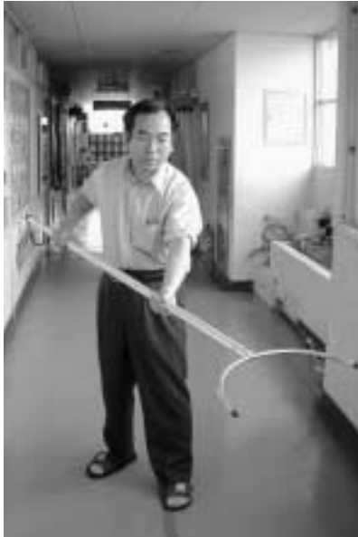
防犯用具の「さすまた」