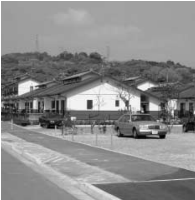
八尋幸ノ浦の改良住宅