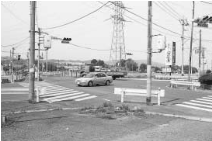
いよいよ工事に着手される新北五差路

本年度の当初予算は、昨年度と比較し、3億788万5千円(4.3%)の減となっております。その要因として、景気低迷の中、町民税等の税収の大幅減、また地方交付税についても、「三位一体の改革」による国庫負担補助金の一般財源化に伴い、公立保育所運営費が普通交付税に算入されたにもかかわらず、5千万円の減を見込んでいます。 主な事業としては、八尋幸ノ浦地区小規模住宅改良事業で、今年度12戸の住宅が建設される予定です。 また、新北五差路の改築工事をはじめます。その他、地域住民の身近な交通手段確保を検討する「町内循環バス導入に関する検討委員会」の経費などが含まれています。