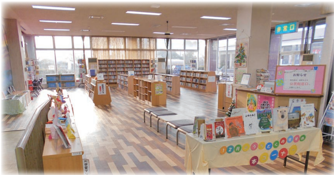
▶中央公民館の図書室

本町の「子ども読書活動推進計画」に沿って、先進地として岡山県都窪郡早島町の図書館を視察見学しております。その図書館は非常に明るくて1階、2階に分かれて非常に立派な図書館だったという印象があります。