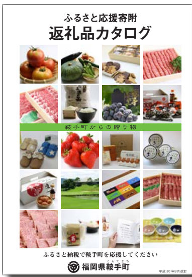
▶ふるさと応援寄附「返礼品カタログ」

政策推進課長 11月よりの全国的なふるさと納税サイトである「ふるさとチョイス」に加入したことで寄附金が増加したことが主な要因です。