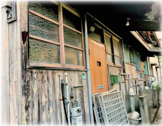
▶長屋の空き家対策は進んでいない。(写真はイメージ)