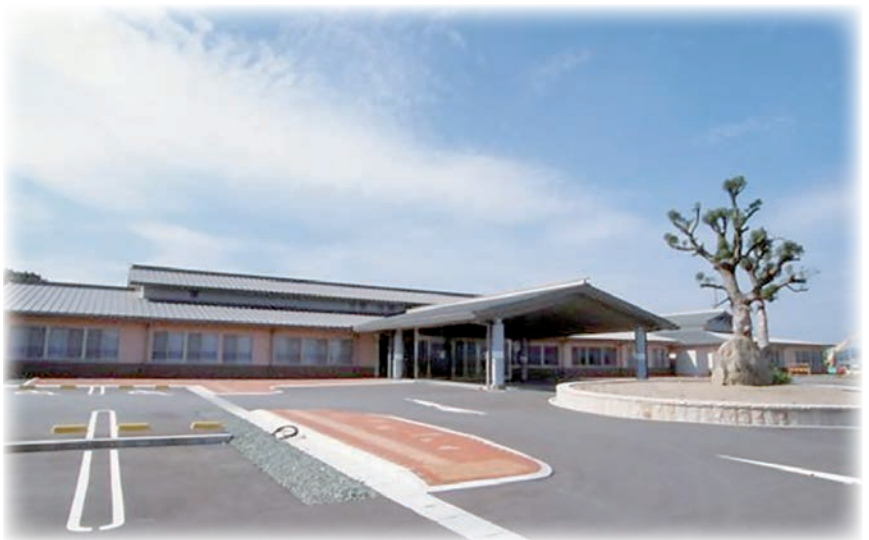
▶町長は「総合福祉センターくらの郷」の存続を表明した。

今後、くらの郷の改修費用はエアコンの更新、雨漏りの修理などで10億ぐらいかかる。10億