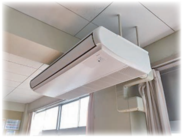
▶来年度には各小学校の教室にエアコンが設置される。(写真はイメージ)