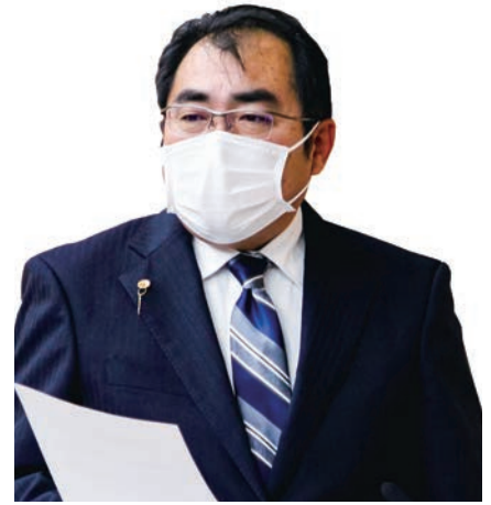
宇田川 亮 議員