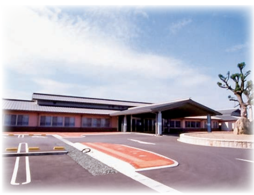
▲維持管理に多額の費用を要するくらじの郷