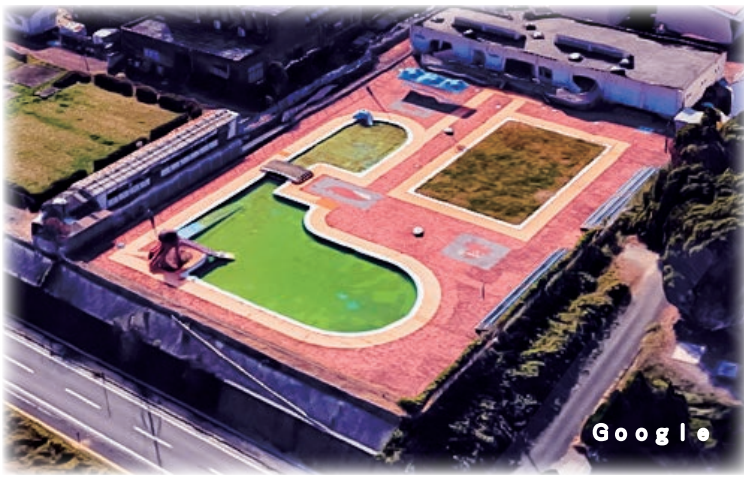
▲昭和61年に開設され長年親しまれてきた総合プールは、35年の歴史に幕を閉じました。

プールは必要だと考えているが、現状を考えてもすぐにプールを建設するという状況になく、私の将来の目標とさせていただけきたい。