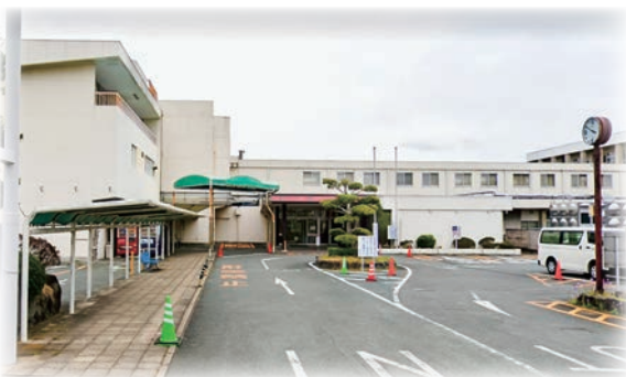
▲地方独立行政法人くらて病院