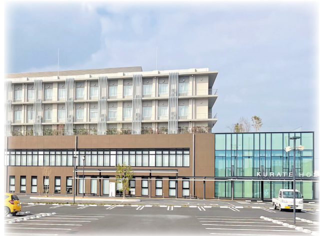
▲地方独立行政法人くらて病院

願いするしかないとの回答でした。今後も定期的な巡回を行い、土地所有者へ環境改善の要求を続けたいと思っています。