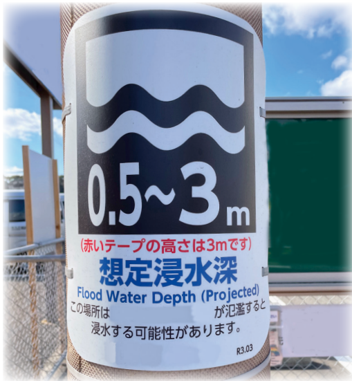
▲浸水想定深表示板のイメージ

想定浸水深にいては現在のところ、表示板等の設置をしておりませんが、今後、設置することが必要