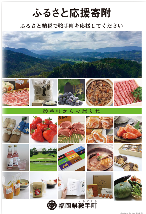
▲ふるさと応援寄附金の返礼品カタログ