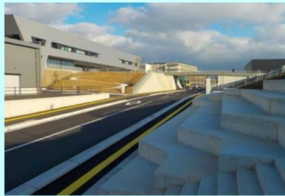
『道路』 町道 裏田・西牟田線新設事業