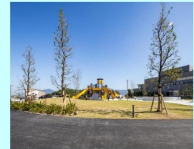
基幹事業 公園整備事業