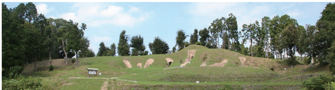
古月横穴整備完了の様子

古月横穴の見学を希望される方は、鞍手町歴史民俗博物館(42-3200)までご連絡ください。