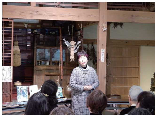
八尋先生の公民館講座でのお話の様子