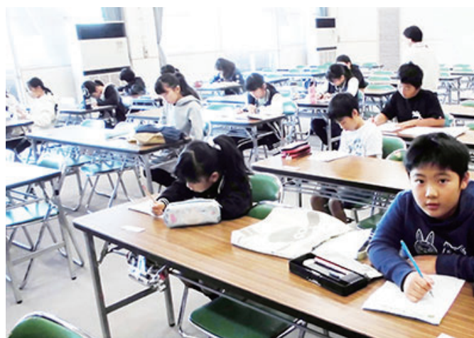
宿題や読書の自習学習の様子