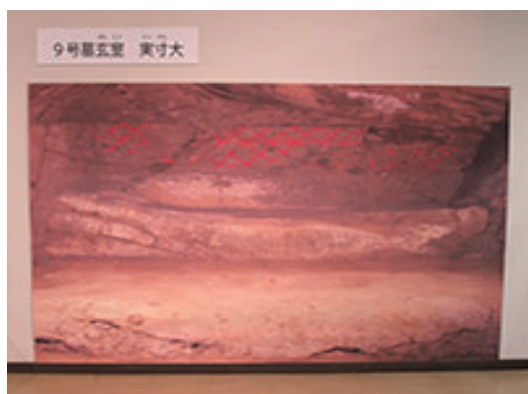
9号墓の実寸パネル