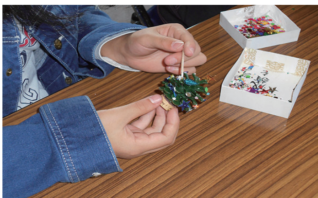
松ぼっくりツリー工作