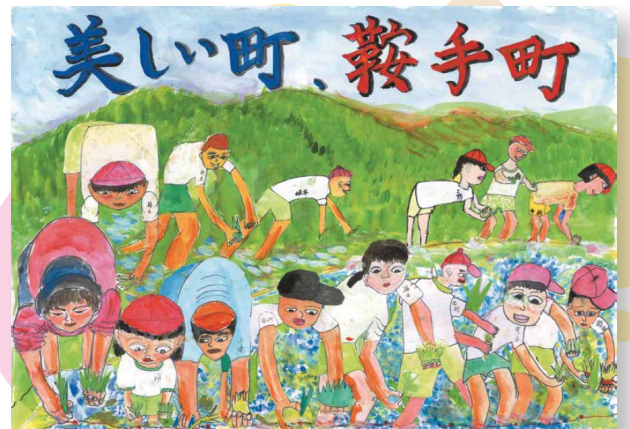
西川小学校 6年生一同