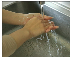
③泡が残らないように水で洗い流す