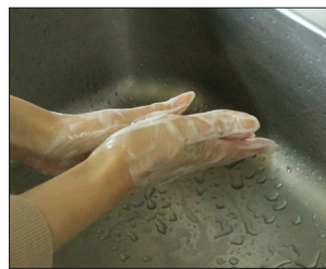
②泡をしっかり立てて手全体をやさしく洗う（指の間や手首も忘れずに）