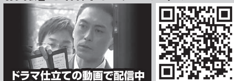
ドラマ仕立ての動画で配信中