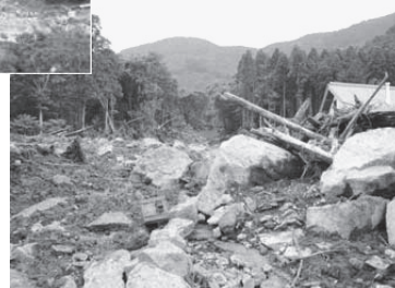
平成24年7月 九州北部豪雨