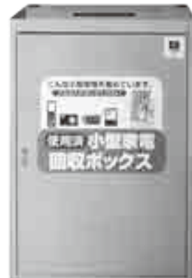
小型家電回収ボックスを設置