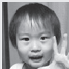
おき が い あ 沖 芽依空くん