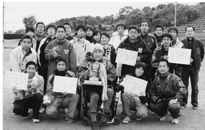
△平成20年12月直鞍一周駅伝競走大会 Aチーム準優勝