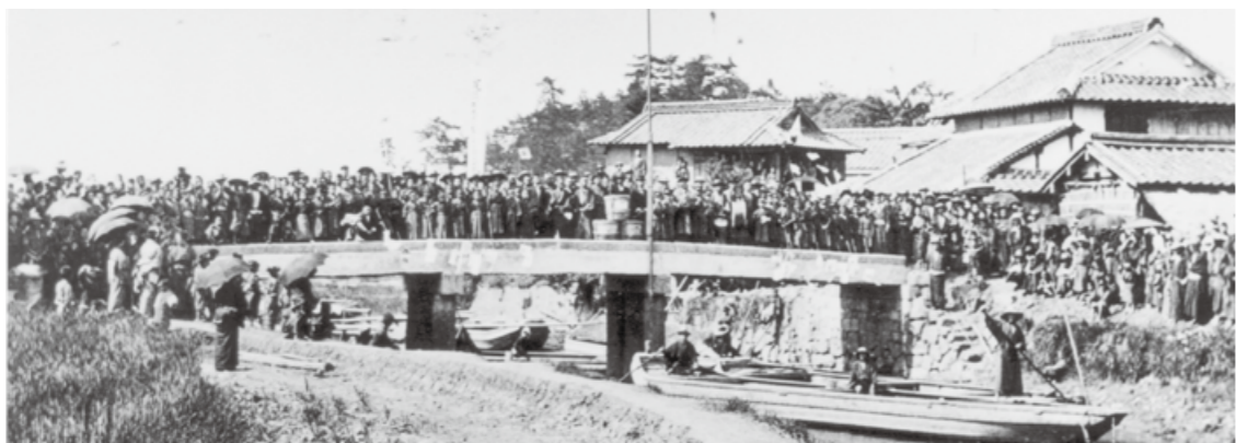
△明治42年西川大橋完成記念式と川ひらた

明治時代に入ると西川流域には多くの小炭坑が生まれ、掘り出された石炭は船積場（川勘場）まで人力や、馬車で運び、川ひらたに積み替えて芦屋・若松等へ送られました。西川には上流から八尋の川端と小木橋、木月の浮殿と大橋、遠賀町の木守と今古賀に6箇所の川勘場がありました。