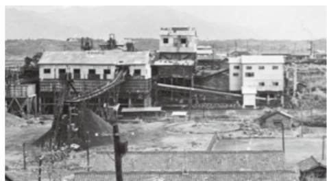
△三菱新入6坑選炭場

明治20年代、筑豊地域には石炭採掘を目的に三菱鉱業、三井鉦山などの企業が進出し、大規模な開発が進められました。明治政府が目指した「殖産興業」政策の一つとして、近代工業のエネルギー源を確保することは国家の威信をかけた重要事項であったと考えられます。