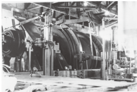
△三菱新入6坑の捲上機

町の石炭産出量は、昭和32年（1957年）頃で年間約50万トン以上の生産で、筑豊炭田の約7%から8%（福岡県では約3%）を占めていました。石炭鉱業合理化事業団の資料によると、町の年間石炭生産量は、約52万3千トンを出炭していたことが、うかがいれます。