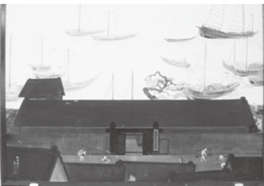
△芦屋焚石会所

石炭は天保9年（1838年）2月6日に風呂たき用に「石から」を購入し、60文を支払っている記録が最初です。その後は、年に1回程度の利用でした。弘化3年（1846年）より年に数回の購入記録があります。弘化4年（1847年）以降は12月末から1月初めに集中して購入しています。安政3年（1856年）1月7日の購入記録が最後となっています。