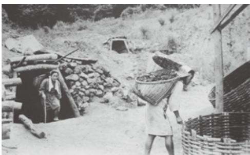
△石炭運び出しの様子