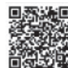
遠賀川河川事務所QRコード