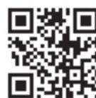
国土交通省QRコード