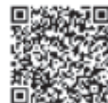
まもるくんQRコード