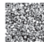
県土木防災情報QRコード

ホームページ http://www.kasen.pref.fukuoka.lg.jp/bousai 携帯 http://www.mobile-doboku.pref.fukuoka.lg.jp